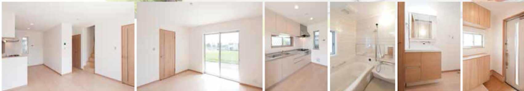
リビングダイニング